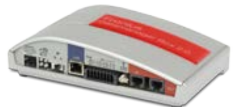
/ Fronius Datamanager Box 2.0

/ Komfortos támogatás , mivel a Fronius Datamanager közvetlenül összeköti az invertert a Fronius Solar.web-bel.